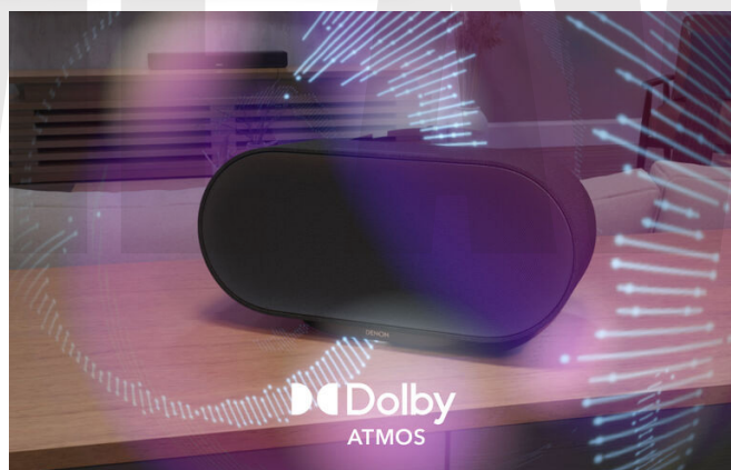
↑ Home 600內建兩組向上發聲的Height單體，因此可支援Dolby Atmos Music播放。實際聆聽時，聲音不只是平面往前投射，而是會自然往上方與左右延伸，呈現更明顯的空間包圍感與沉浸感。