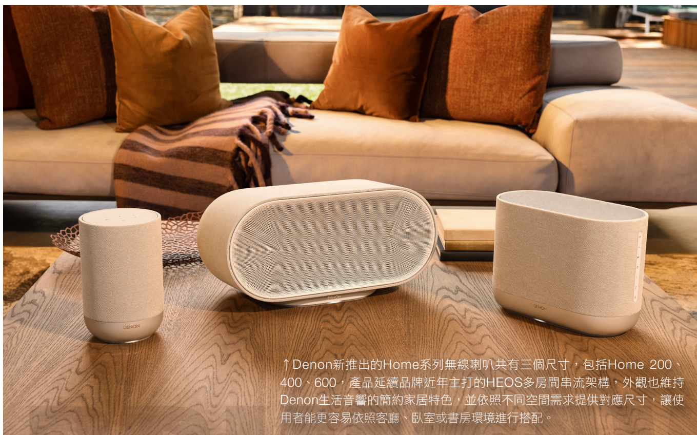
↑ Denon新推出的Home系列無線喇叭共有三個尺寸，包括Home 200、400、600，產品延續品牌近年主打的HEOS多房間串流架構，外觀也維持Denon生活音響的簡約家居特色，並依照不同空間需求提供對應尺寸，讓使用者能更容易依照客廳、臥室或書房環境進行搭配。