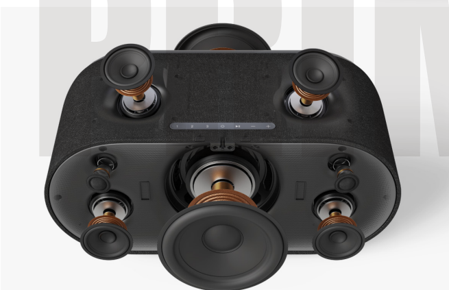
↑ Home 600是此次系列中體積最大的旗艦型號，內部配置八個單體，包括高音、中低音、Height單體與雙6.5吋低音單體，組成2.1.2聲道架構。搭配獨立擴大機驅動，可營造出遠超過一般無線喇叭的聲音規模感。