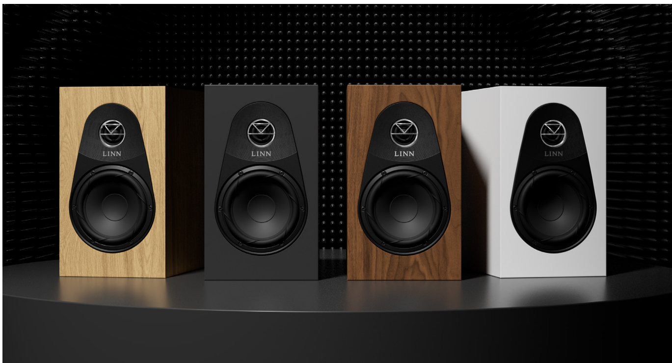
● 119外觀就是很正統的書架喇叭。不過因為119沒有提供網罩，因此高音部分使用商標形狀的金屬罩保護。一共提供胡桃木、橡木、緞面黑、緞面白四種顏色可選。

端搭配什麼，舞台大小其實並沒很有明顯的差異，能夠完全展現開闊的視野。低音部分119就是小型書架該有的樣貌，有適當用低音管噴出的氣流補足量感與延伸，使三頻比例微微呈現金字塔型；不過因為收尾很迅速低音反而顯得清爽。