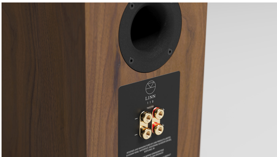
● 119較特別的是喇叭端子有兩組，主動版時就必須使用兩組。且喇叭端子特別扁平，因為Linn希望用家使用香蕉插。

喇叭，且依舊在Linn自家工廠內製造。但獨有的主被動切換設計，讓用家可以在聆聽一陣子之後，依舊能繼續升