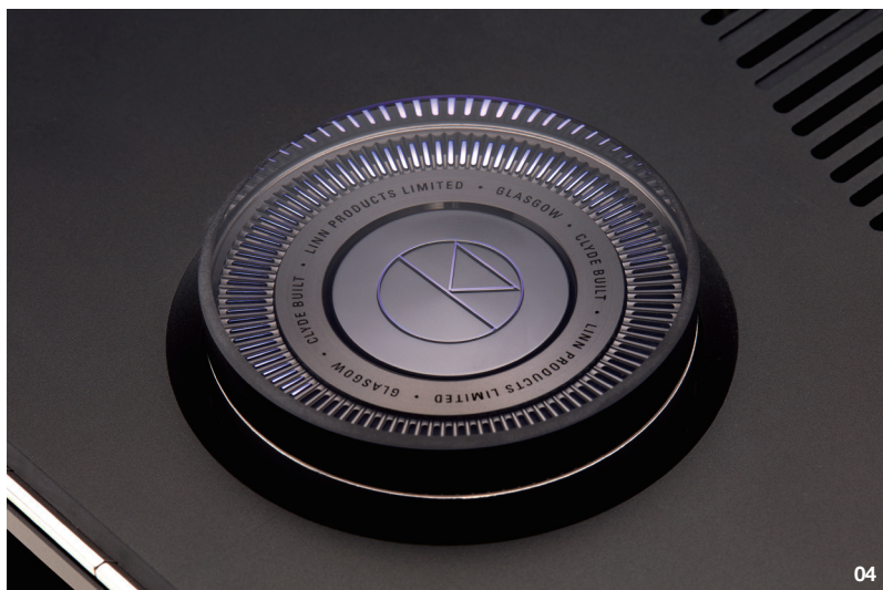
04. Selekt DSM Edition Hub的這個由100個LED所組成的光環操控鈕具有多用途。