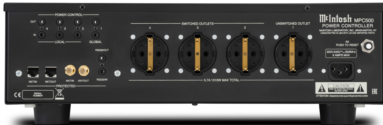
下圖: MPC500搭配Type F (等於CEE 7/3或“Schuko”) 插座