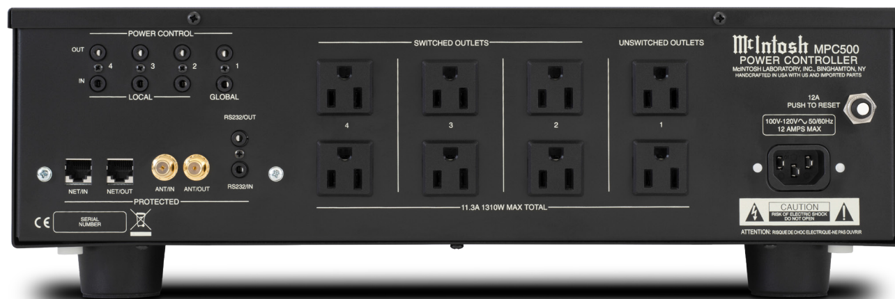
上圖: MPC500搭配Type B (等於NEMA 5-15R) 插座