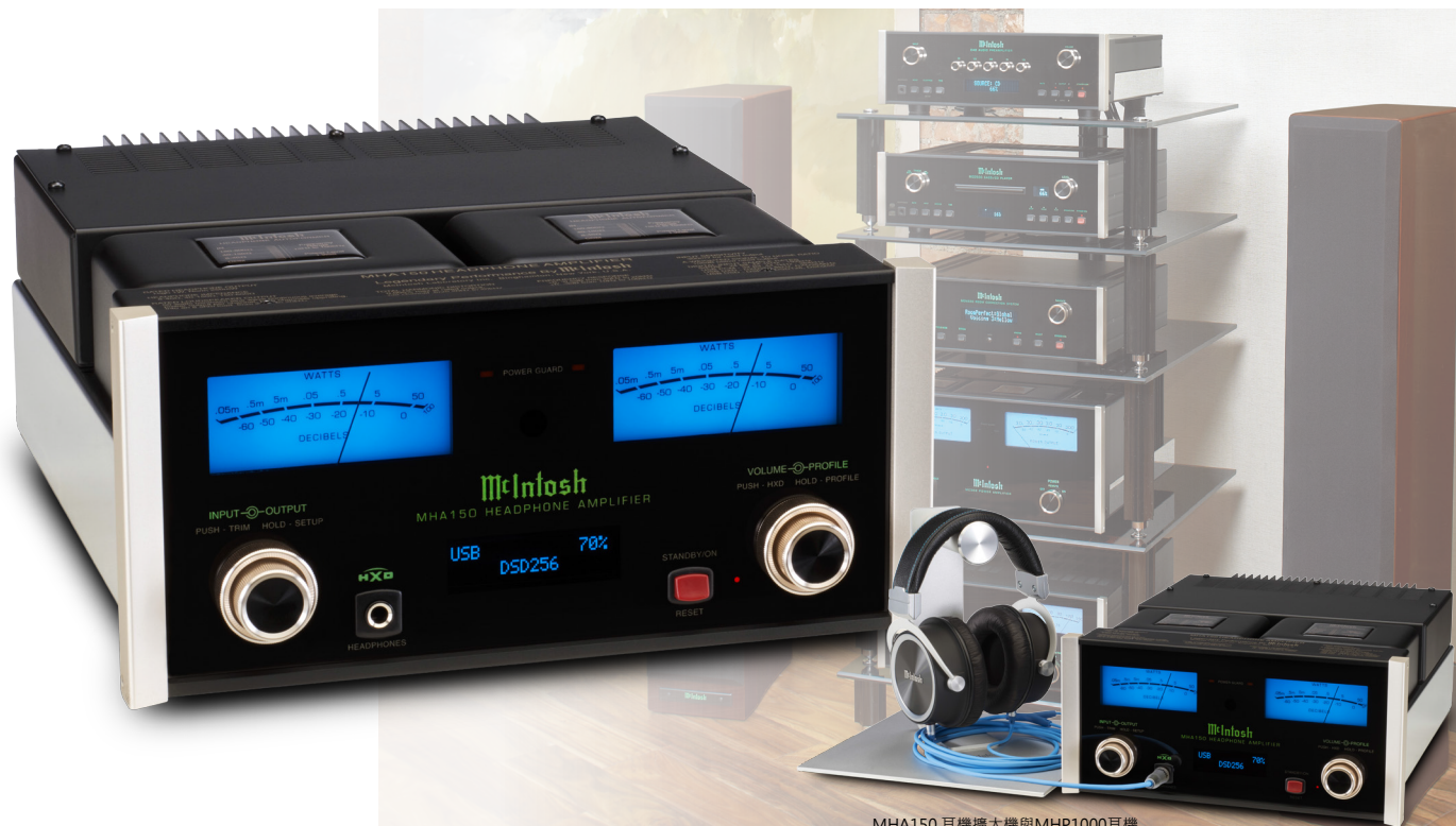
MHA150 耳機擴大機與MHP1000耳機 MHP1000單獨販售