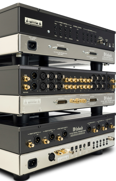
D1100 (底部) 與可選配的C1100 一起展示，所有產品皆分別販售