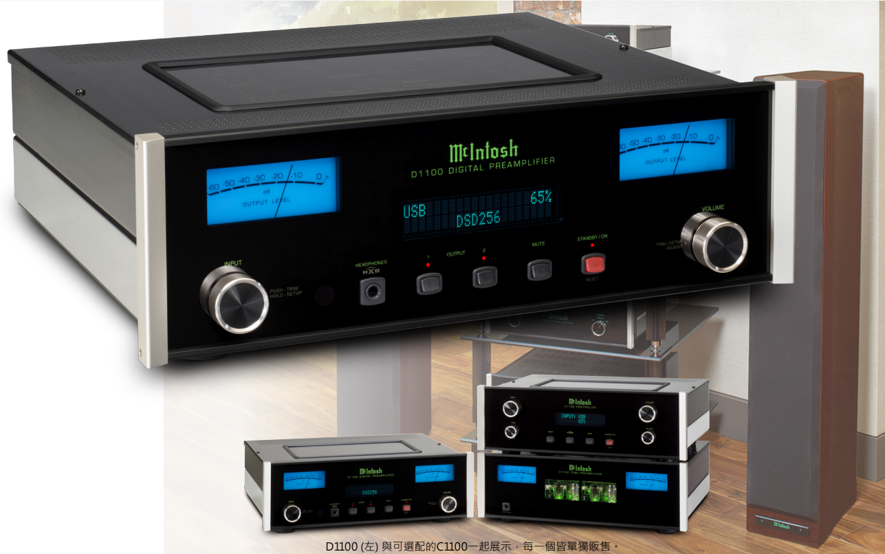
D1100 (左) 與可選配的C1100一起展示，每一個皆單獨販售。